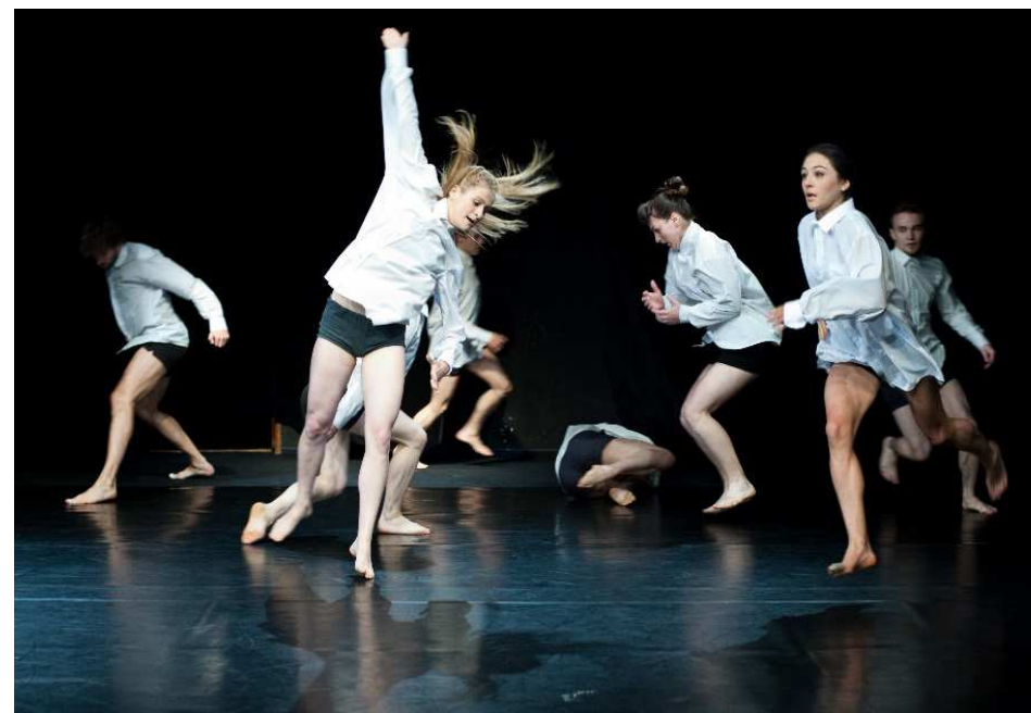
Materia Prima. 3. Międzynarodowy Festiwal Teatru Formy. Bieguny kultury Teatr Groteska w Krakowie