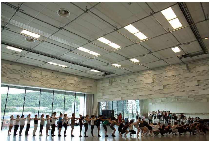
Poznanie przez taniec Teatr Wielki - Opera Narodowa w Krakowie