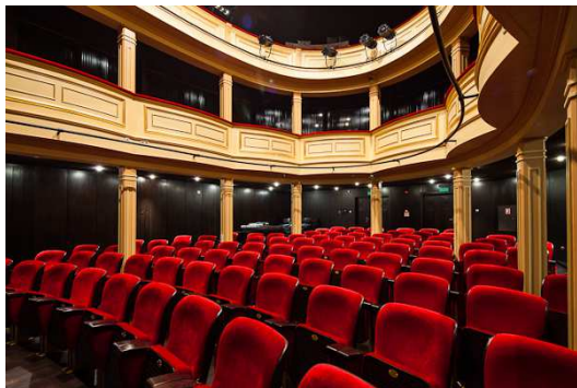
Teatr Stary w Lublinie