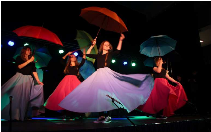
Szeksploracje kultury Gdański Teatr Szekspirowski