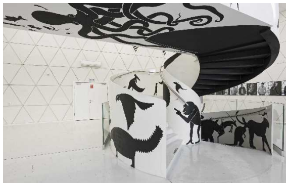
Opolski Teatr Lalki i Aktora im. Alojzego Smolki w Opolu