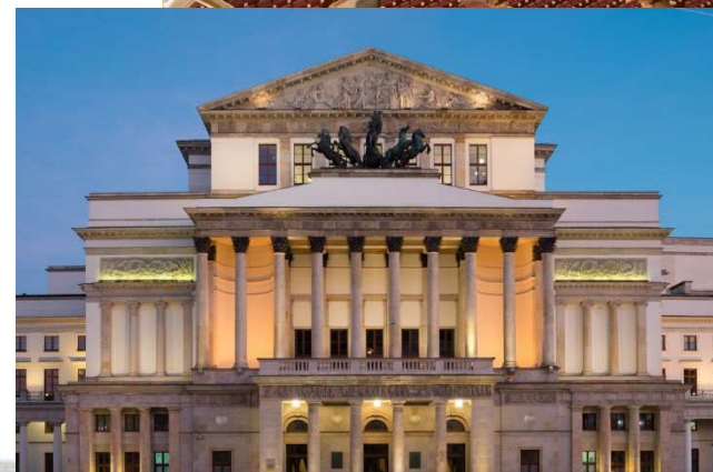
Teatr Wielki Opera Narodowa