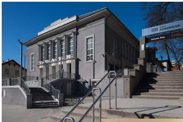
Teatr Jaracza w Olsztynie