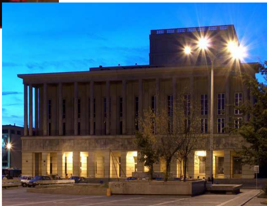
Teatr im. Juliusza Słowackiego w Krakowie