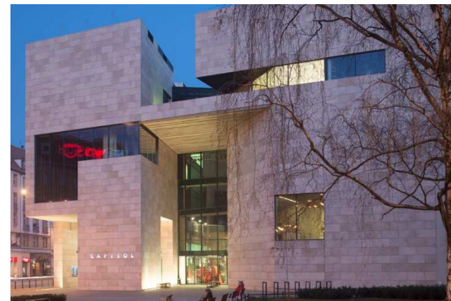
Teatr Capitol we Wrocławiu